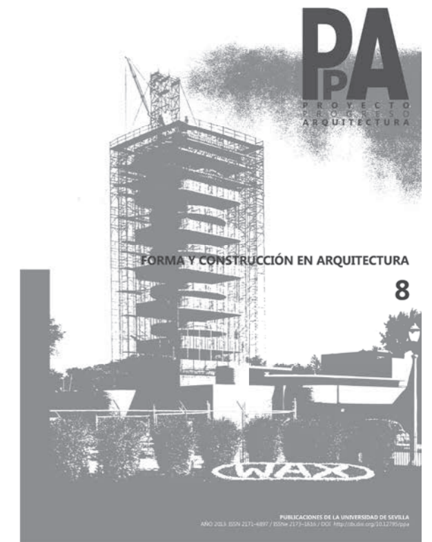
PPA N08 FORMA Y CONSTRUCCIÓN EN ARQUITECTURA (AÑO IV, mayo 2013)