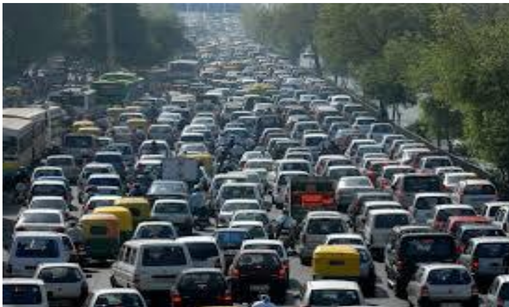
Ilustración 2. No sabemos controlar nuestras necesidades.

México es sin duda un país con una riqueza enorme de recursos naturales, sin embargo, al igual que muchos otros, todavía necesita avanzar en esfuerzos que concreten las intenciones institucionales del Estado. El desafío actual de México es continuar su crecimiento económico bajo una ética de justicia social y de uso racional y eficiente de los recursos naturales, así como de preservación del equilibrio ecológico.