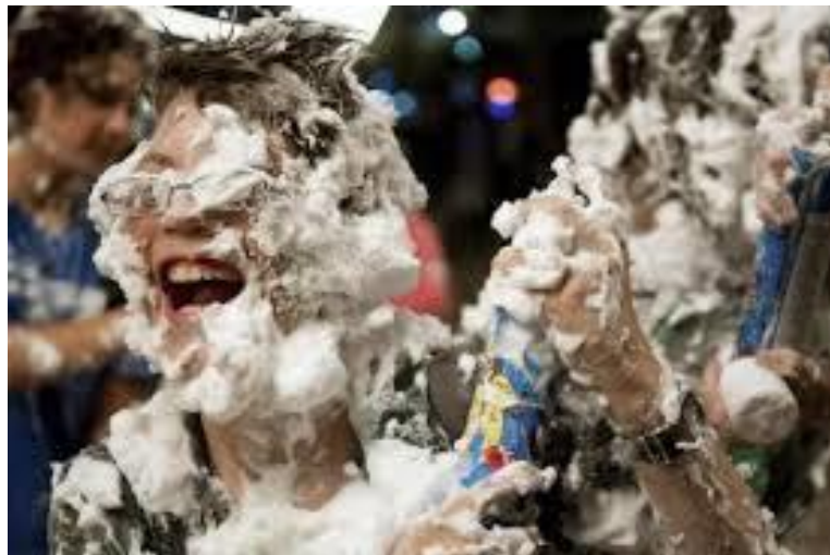
Ilustración 1. La contaminación se confunde con diversión.

Si se reflexiona un poco, toda la actividad de los seres vivos, incluyendo entre ellos al ser humano, de una manera consciente o inconsciente aun cuando no lo sepamos o no pensemos en ello, todos contribuimos a la contaminación del aire. Si bien ensuciamos el aire, todos podemos y debemos colaborar a no deteriorarlo más y a hacer que el aire que respiramos tenga mejor calidad. ¿Cómo hacerlo? Cambiando nuestros hábitos diarios. No es raro que pensemos que no tiene sentido cambiar nuestros hábitos pues lo que haga una sola persona no solucionará el problema. Sin embargo, si cada uno de nosotros cambiara algunos de sus hábitos, todos estos esfuerzos acumulados sí pueden tener un claro impacto en la calidad de nuestro aire