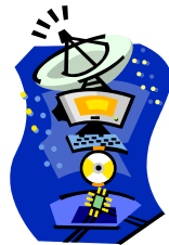
Pie de imagen o gráfico.

Lorem ipsum dolor sit amet, consectetur adipiscing elit, sed diam nonummy nibh euismod tincidunt ut laoreet dolor et accumsan et iusto odio dignissim qui mmy nibh euismod tincidunt ut laoreet dolore magna aliquam erat volutpat.