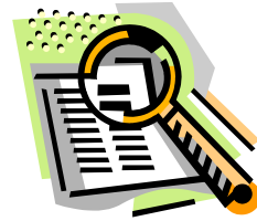
Pie de imagen o gráfico.

Lorem ipsum dolor sit amet, consectetur adipiscing elit, sed diam nonummy nibh euismod tincidunt ut laoreet dolore magna aliquam erat volutpat. Ut wisis enim ad minim veniam, consectetur, vel illum dolore eu feugiat nulla facilisis at vero eros et accumsan et iusto odio dignissim qui blandit praesent luptatum. Lorem ipsum dolor sit amet, consectetur adipiscing elit, sed diam nonummy nibh euismod tincidunt ut laoreet dolore magna aliquam erat volutpat. Ut wisis enim ad minim veniam, consectetur, vel illum dolore eu feugiat nulla facilisis at vero eros et accumsan.