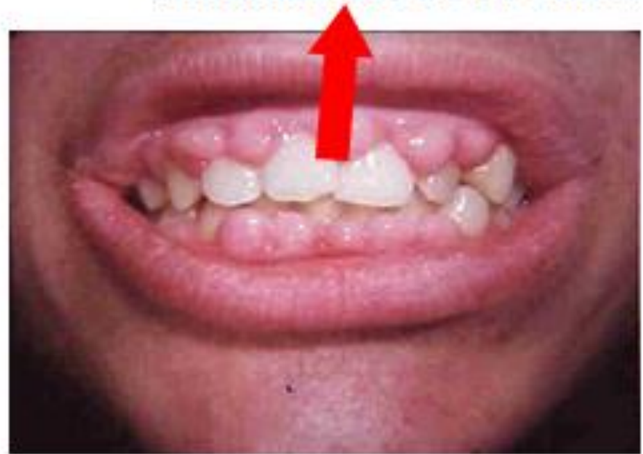
Inflamación de la encía

☞ es la inflamación de las encías que se caracteriza por enrojecimiento y sangrado, es causada por las bacterias de la placa que no se han removido adecuadamente.