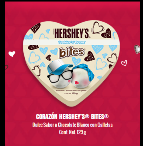
CORAZÓN HERSHEY'S® BITES® Dulce Sabor a Chocolate Blanco con Galletas Cont. Net. 129 g