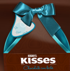
KISSES CAJA REGALO