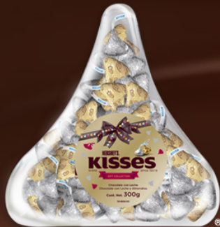
ESTUCHE SURTIDO KISSES