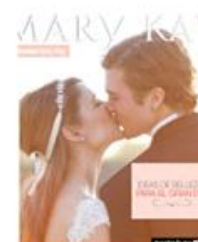
Folleto Novias Mary Kay