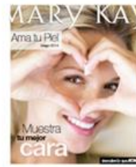
Folleto Ama tu piel