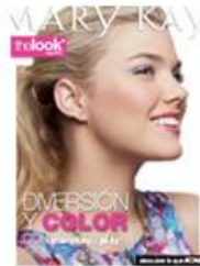
Folleto The Look