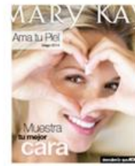
Folleto Ama tu piel