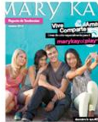
Reporte de Tendencias