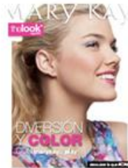
Folleto The Look