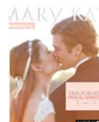
Folleto Novias Mary Kay