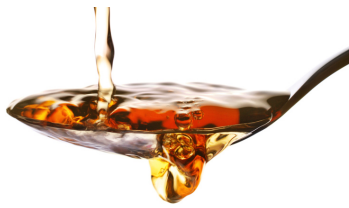
Cuchara de vinagre