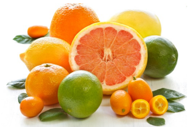
Naranjas y limones