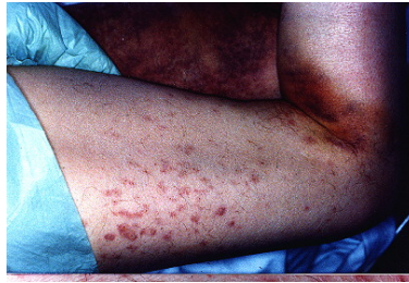
Manchas en la piel